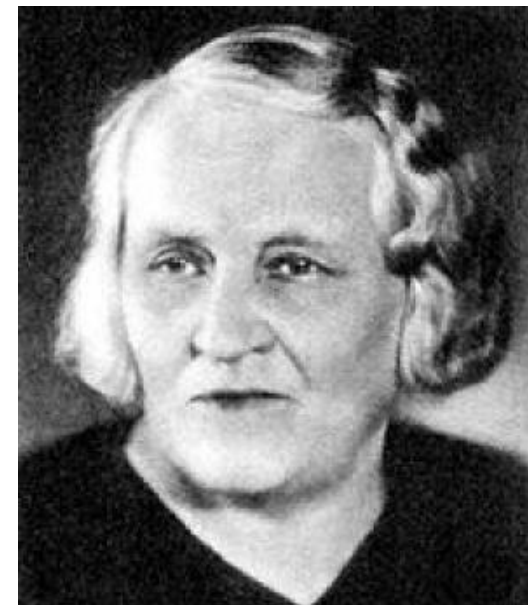
Božena Slančíková –Timrava pod Tatrami