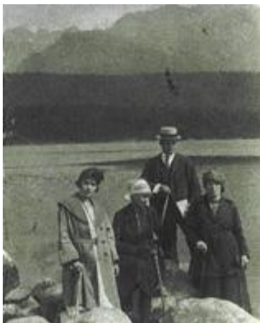
Timrava so sestrinými deťmi na Štrbskom plese r. 1921

In Timrava v kritike a spomienkach : sborník . Bratislava : Slovenské vydavateľstvo krásnej literatúry, 1958, s. 68