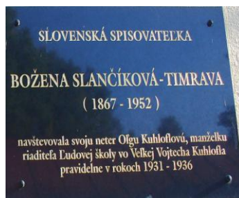
Pamätná tabuľa v Poprade-Veľkej

„Zápis pre š.r. 1931/1932 prevedený bol dňa 26. a 27. júna. Školu navštívila slovenská spisovateľka „Timrava“, ktorá je v rodinnom pomere so správcom školy. Jej vzácna návšteva zväčšuje sa na pamiatku i v kronike školy.“