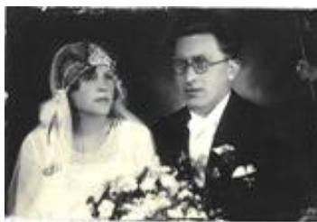
Krstná dcéra Timravy

Slovenské vydavateľstvo krásnej literatúry, 1958, s. 95 – 96