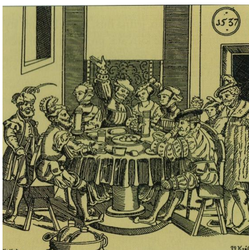
Hostina Cechu gombikárov