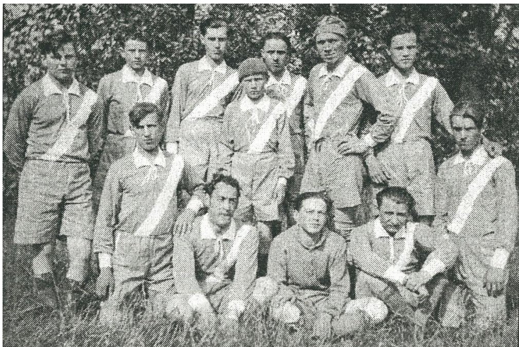
Fotografia prvého futbalového družstva dospelých z roku 1936 v Slovenskej Vsi