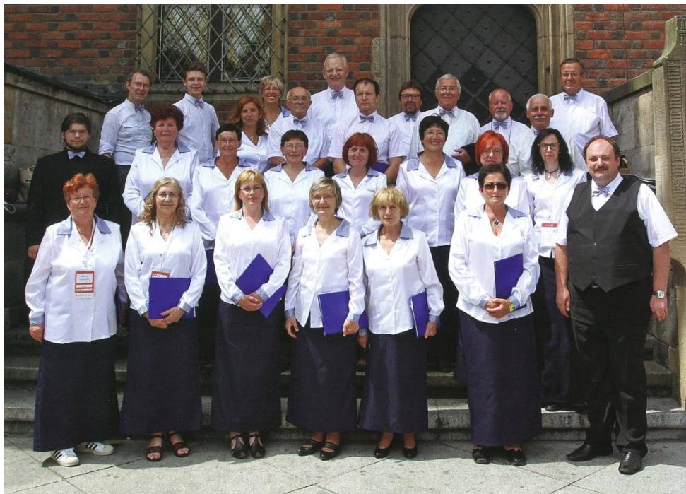
Spevokol Evanjelického cirkevného zboru Kežmarok