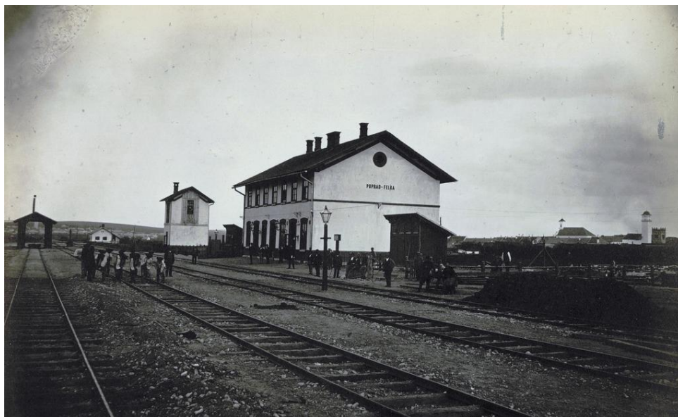
Železničná stanica Poprad – Felka