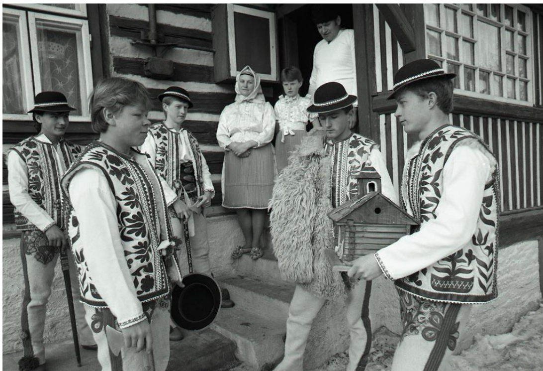
Vianoce v Lendaku