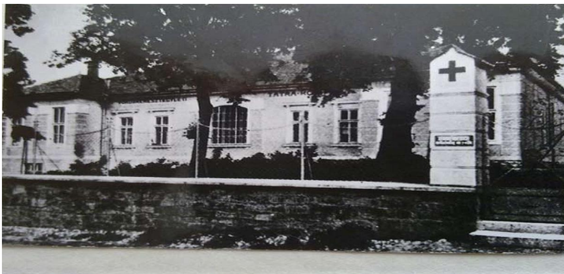
Nemocnica Červeného kríža v Spišskej Sobote