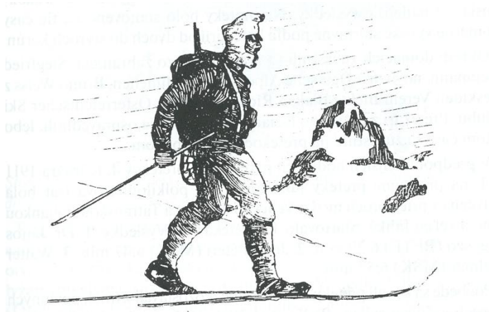
Na štarte pretekov v roku 1899 v hliadkovom výstroji.

„Prvé lyžiarske preteky v kolíske lyžovania v Nórsku usporiadala armáda v roku 1767 a o 132 rokov neskôr sa táto história zopakovala aj na Slovensku. Od 8. – 27. februára 1899 usporiadal 34. cisársko-kráľovský pluk lyžiarsky kurz vo Vysokých Tatrách. Zúčastnilo sa na ňom 39 dôstojníkov a 49 poddôstojníkov a vojakov. Kurz mal základňu v Štrbe a výcvik sa konal v okolí Štrbského Plesa. Účastníci mali za úlohu zvládnuť základy lyžovania a potom na lyžiach absolvovať vytrvalostné kondičné pochody denne od 15 do 54 km, pri hodinovom výkone 4,9 až 7,5 km. Kondične diaľkové presuny vykonali v hustých lesoch, v členitom teréne, prechodmi cez vodné toky a cez iné prírodné prekážky. Na záver 27. februára 1899 nastúpili účastníci kurzu na diaľkový lyžiarsky beh na trase Štrba – Štrbské Pleso – Veľký Slavkov, pri ktorom prekonal za hodinu 10 km. Boli to v skutočnosti prvé lyžiarske preteky v behu na lyžiach na Slovensku.