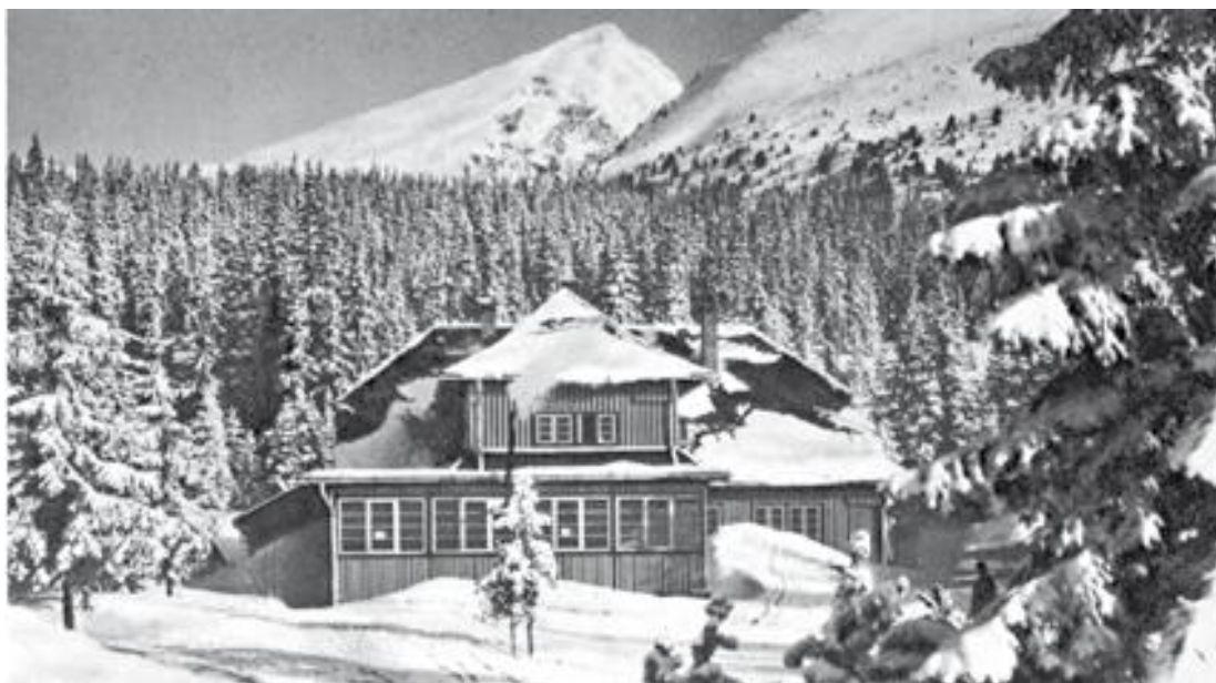
Krivánska chata (Nedobrého chata)