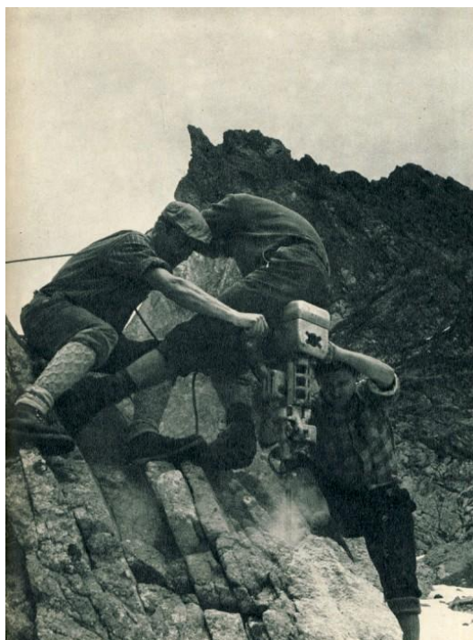
Zabezpečenie turistických ciest reťazami a skobami (Priečne sedlo)