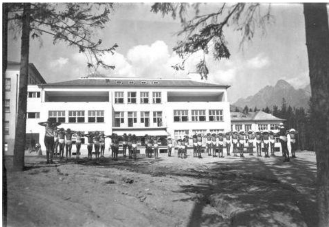
Šrobárov ústav detskej tuberkulózy a respiračných chorôb