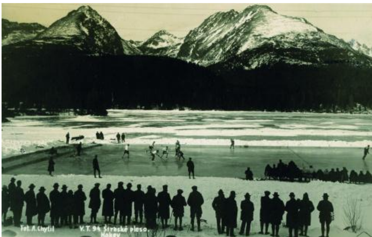
Majstrovstvá Európy v ľadovom hokeji (1925)

„Ich usporiadaním bol poverený Československý zväz kanadského hokeja a boli to už desiate majstrovstvá. S veľkou slávou sa mali konať v Prahe za účasti šiestich mužstiev. Lenže, v Prahe nedokázali pre veľké novoročné oteplenie urobiť ľad. Ani náhradná plocha na rybníku Jordán v Táboře nebola schopná a bezpečná, ba do tretice sa usporiadateľom nevydarili ani rokovania s majiteľmi vtedy najbližšej ľadovej plochy s umelým ľadom vo Viedni. Riešením sa stali Vysoké Tatry, no tam pricestovali už iba štyri mužstvá: Belgicko, Československo, Rakúsko a Švajčiarsko. Dejiskom majstrovstiev malo byť Štrbské Pleso, a tu sa aj na upravenej ploche jazera odohral v roku 1925 prvý medzištátny zápas v ľadovom hokeji na území Slovenska. Bol to úvodný zápas ME 1925 medzi mužstvami Československa a Rakúska. Mužstvo Československa zvíťazilo 3:0. Potom sa s organizátormi a hokejistami pohralo počasie. V už prudkej snehovej búrke dohrávali svoj zápas Belgičania so Švajčiarmi, ktorý sa napokon skončil 1:1. Ďalšie konanie majstrovstiev nebolo na Štrbskom Plese možné, hoci bolo nasadených až 140 ľudí na úpravu a udržiavanie ľadovej plochy. Organizátori už po štvrtý raz menili zamýšľané dejisko. Tentoraz však iba o 18 km ďalej a nižšie – do Starého Smokovca. Tu hrali Čechoslováci aj dva ďalšie zápasy, so Švajčiarskom 1:0 a s Belgickom 6:0“ (Argalács 2014, s. 7-8) 12 .