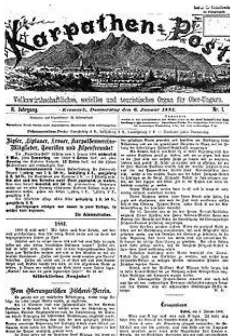
Týždenník Karpaten Post