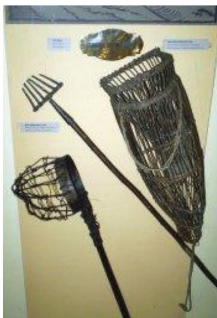
Nástroje na lov rýb v Kežmarku