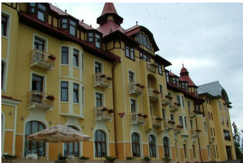
Grandhotel Praha v súčasnosti