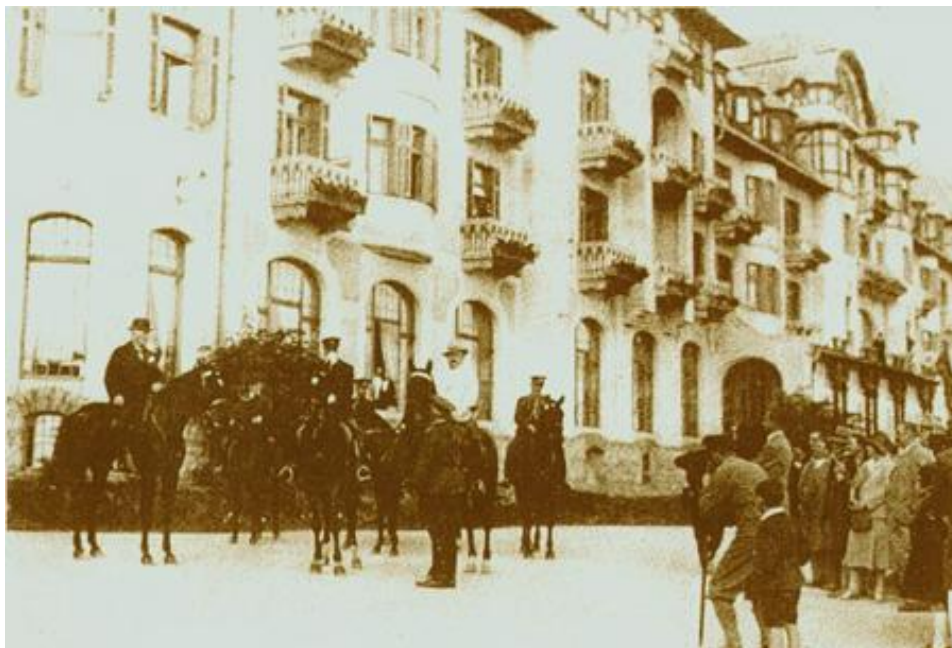
Grandhotel Praha v minulosti