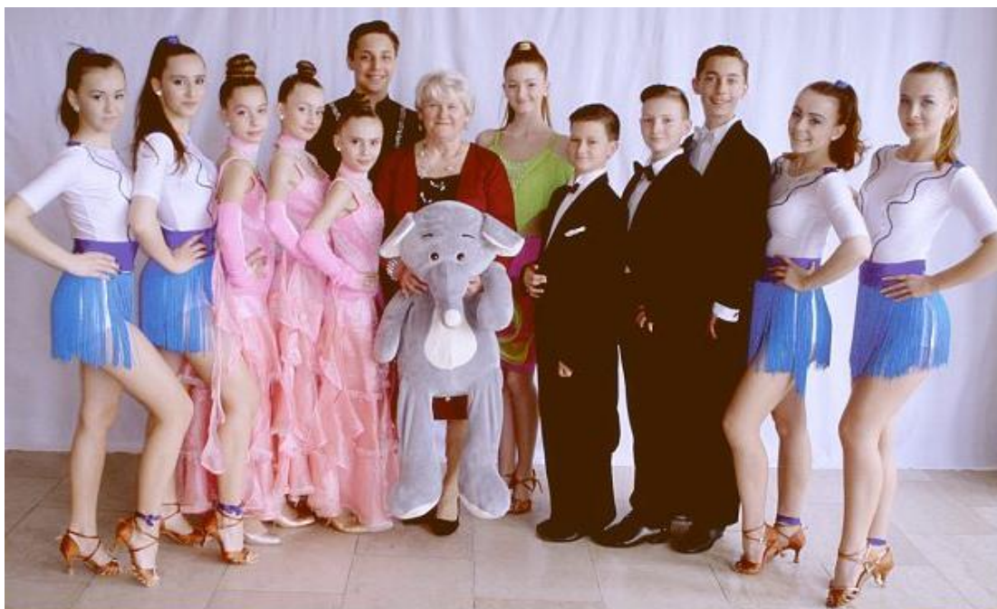
Tanečno-športové centrum Tempo Kežmarok