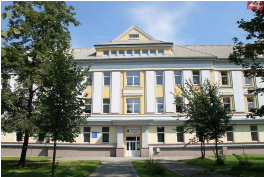
Gymnázium Kukučínova Poprad