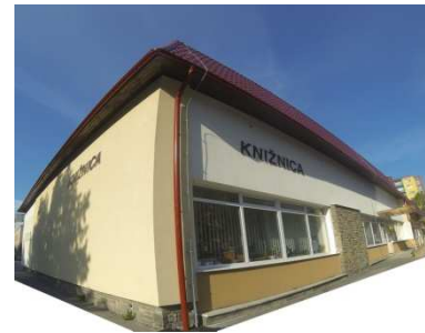
Centrum, Podtatranská ul. č. 1

Centrum, oddelenie pre deti, Podtatranská ulica č. 1