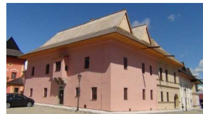
Oddelenie umenia, Spišská Sobota