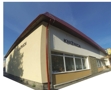
Centrum, Podtatranská ul. č. 1