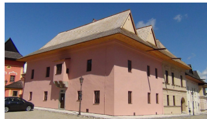
Oddelenie umenia, Spišská Sobota