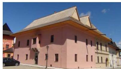
Oddelenie umenia, Spišská Sobota