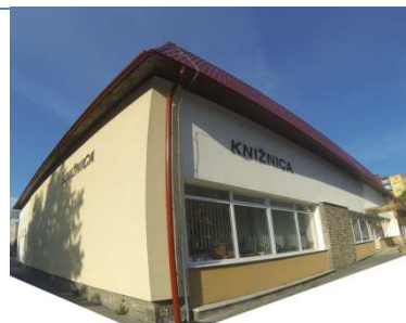
Centrum, Podtatranská ul. č. 1